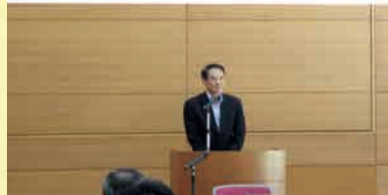
伊那市県道整備促進期成同盟会 総会

この会は、市内にある20の県道のうち重点的に整備が必要な5路線の整備を促進するため、市長・議長・関係区長等で構成されています。